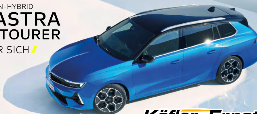
Abbildung zeigt Sonderausstattung. Werte nach WLTP: Energieverbrauch (gewichtet, kombiniert) 1,2-1,1 l/100 km und 15,3-14,8 kWh Strom/100 km; rein elektrische Reichweite 59-60 km; elektrische Reichweite, innerorts (EAER City) 67-72 km; CO 2 Emission (kombiniert) 27-25 g/km.

3013 Tullnerbach-Preßbaum, Hauptstraße 35 Telefon 02233/52381, E-Mail office@koefler.eu